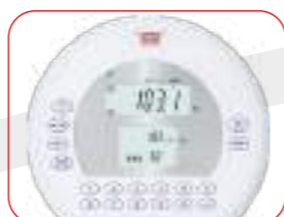
WBA - Tripla lettura Peso-Bmi-% M.Grassa