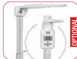
Statimetro telescopico manuale: Lettura digitale o serigrafata