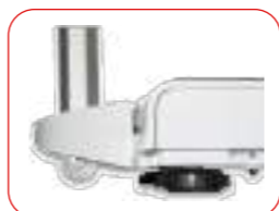
Ruote per un semplice trasporto- piedini regolabili