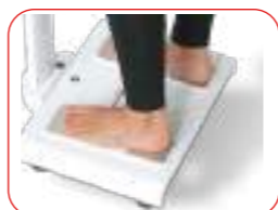
Misurazione piedi scalzi a contatto con elettrodi BIA